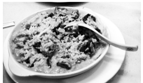
港饮港食白汁海鲜饭