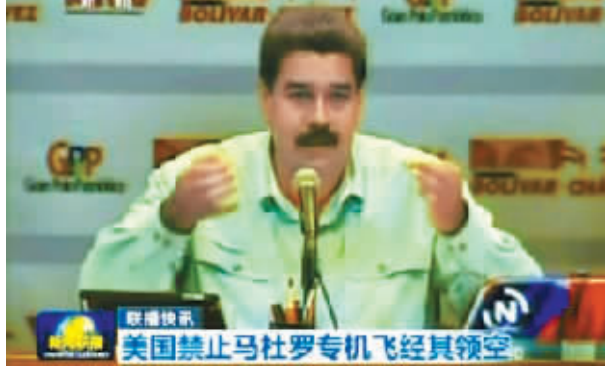
19日,马杜罗谴责美国拒绝其专机过境

委 内瑞拉19日说,美国拒绝总统马杜罗访问中国所乘专机过境美国海外属地波多黎各,这一行为“侵犯”委内瑞拉主权。美国国务院一名高级官员试图澄清,称美方并没有拒绝马杜罗专机过境美国领空。马杜罗说,美国同样拒绝他的幕僚长率代表团赴纽约参加联合国大会。