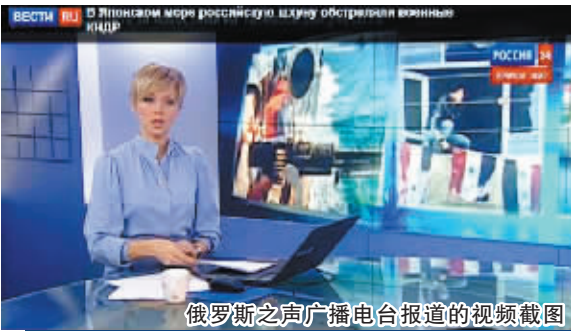
俄罗斯之声广播电台报道的视频截图

据 俄新社报道,俄罗斯一家渔业公司称,符拉迪沃斯托克时间21日凌晨,该公司一艘渔船在日本海遭到朝鲜海岸边防部队开火,但没有人受伤,船只也未遭到损坏。